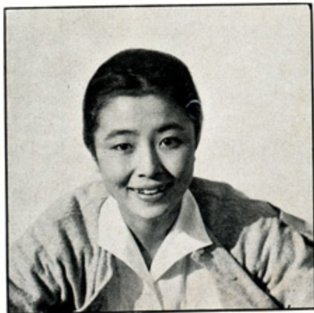
上の写真は AIII型の6×6判原寸サイズ。

フラッシュ撮影をどうぞ 夜間や室内での撮影も、AIIIにフラッシュガンを取付けば簡単にできます。下の写真はAIIIで室内フラッシュ撮影したものです。絞3.5、赤でF球閃光電球を使用しました。